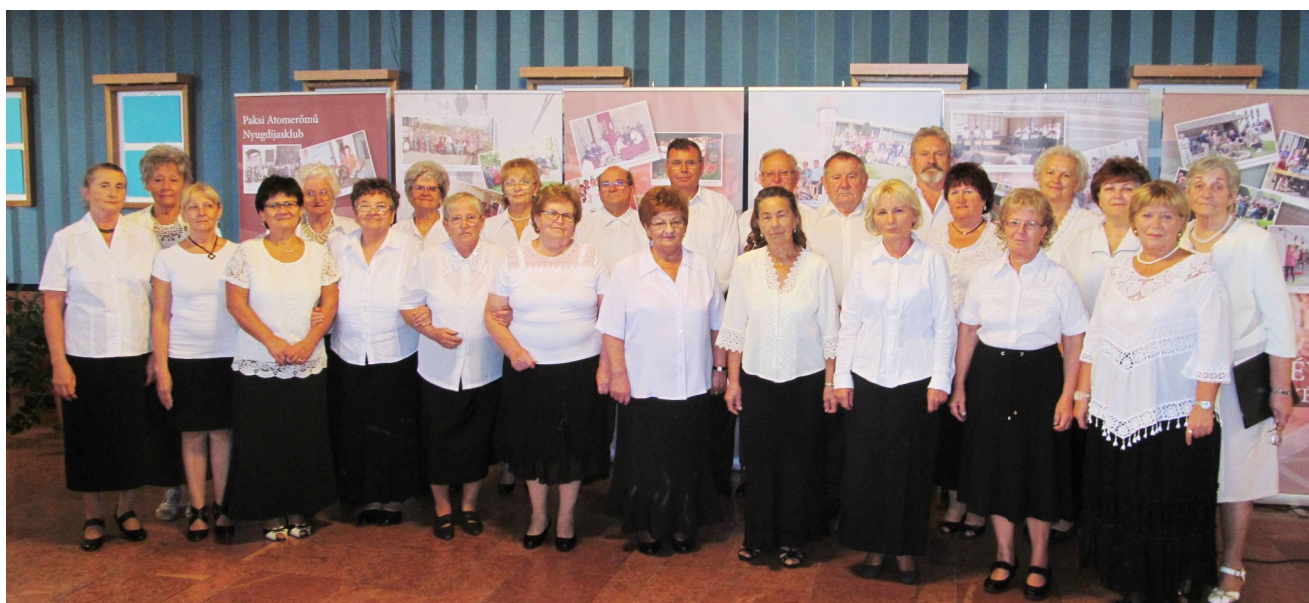
A klub énekkara

A cikk szerzője: Lehmann Katalin