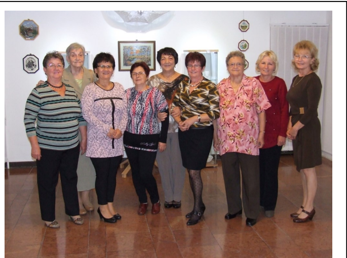
A kézimunkázók egy csoportja