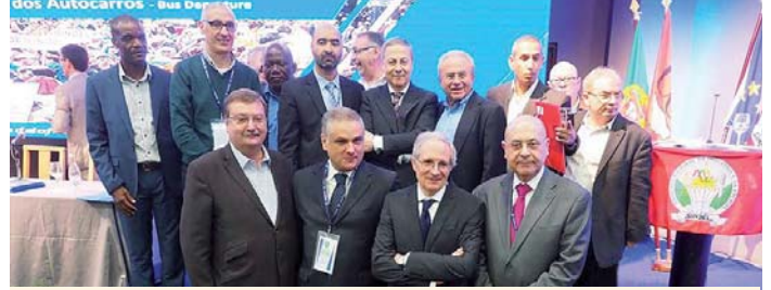
2017. márc. 9-13., Póvoa de Varzim (Portugália)

Törökország belpolitikai, külpolitikai helyzete is meghatározóvá vált az elmúlt időszakban. Erdogán újraválasztása megtörtént. Tüntetések vannak, melyen szakszervezetek is részt vesznek. Több szakszervezeti tagot is