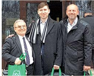
2017. ápr. 04-07., Moszkva

A 2016-os párizsi COP 21 Klímakonferencia után az egyezménybe bekerült az „Igazságos átmenet” fogalma. Az elhatározottak szerint 40%-kal csökkenteni szükséges a CO kibocsátást, 27%-kal növelni kell a megújuló energiaforrások arányát, valamint 27%-kal a határfoknak is növekednie kell. Hagyományos erőművek