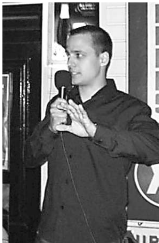
„Porki” előadás közben

ki merek állni a színpadra, nem mondható rólam, hogy bátorlalan vagyok. Ezért mindig megyek és próbálkozom kellemes perceket okozni a vendégeknek. Emellett ez az önmegvalósítás kiváló eszköze is. Ki ne szeretné, ha úgy