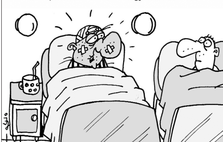
ÚJ ÉV, ÚJ ÉLET... - Eddig nem ittam, nem cigiztem, most már van rá okom