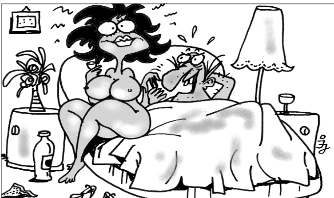
ÚJÉV - Persze, hogy nem éreztél semmit szívi, aneszteziológus vagyok