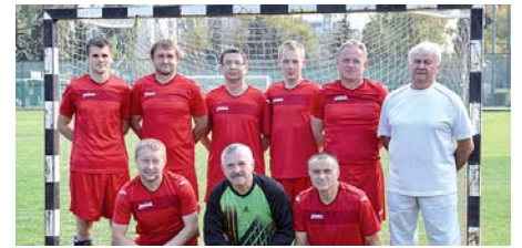
Az egész nap zajló mérkőzések és az esti kulturális program után pihentető volt számukra az éjszaka.

A látogatás második napján zajlott az EVDSZ I. Nemzetközi focikupája, amelyen a csapat sportszerű, harcos küzdelmekben állhatott fel a képzeletbeli dobogó III. fokára.