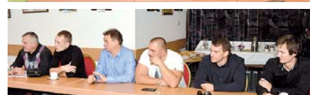
A kerekasztal beszélgetés résztvevői

Szervezeteink kölcsönös bemutatkozása és a nemzetközi, országos szakszervezeti munka tapasztalatainak megosztása után a delegáció megismerhette Budapest nevezetességeit.