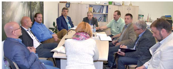
Az SZV ülést megelőzően ülésezett az EVDSZ Elnöksége is