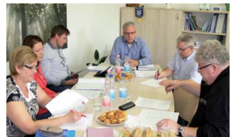
Az EVDSZ Felügyelőbizottsága