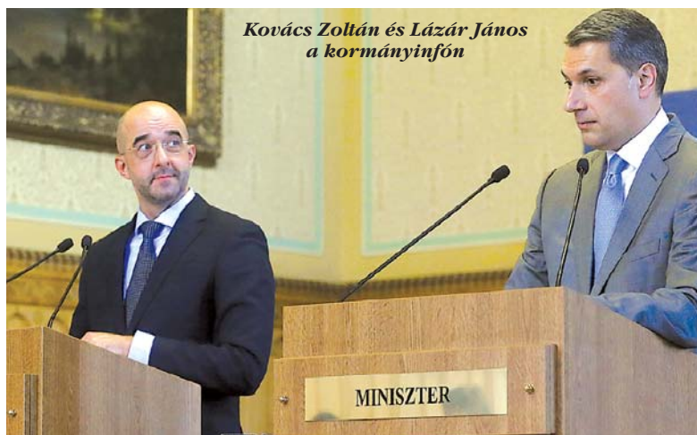
Kovács Zoltán és Lázár János a kormányinfón

NÖVEKEDÉS A miniszter elárulta, a szerdai kormányülés foglalkozott a vártnál gyengébb, 0,9 százalékos negyedéves GDP-adattal, és a következő időszakban lépéseket tesznek a növekedés gyorsítása érdekében. Hozzátette: a kormány várakozása továbbra is az, hogy 3 százalék közeli lesz a növekedés idén. A Fitch Ratings hitelminősítő Magyarországot felminősítő döntését Lázár János úgy kommentálta: a hír önmagában nem hozta lázba a kormányt, amely ugyanilyen nyugalom-