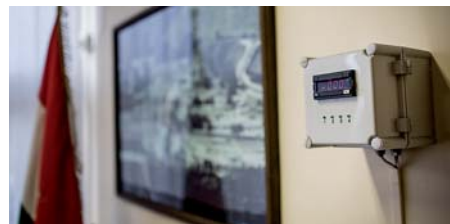
A vezérigazgatói irodában egy mérőórán évtizedekig követhető volt a megtermelt áram mennyisége.