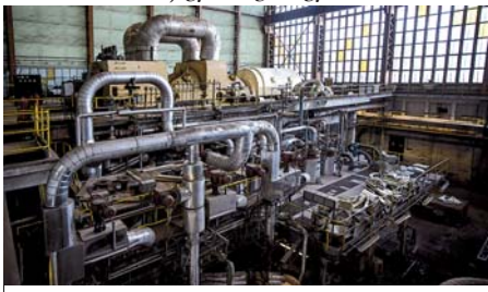
A turbínacsarnokban négy különálló blokkban van egy-egy gőzturbina és generátor, melyeket négy kazán lát el gőzzel

A ventilátorokat már szétszerelték, az embernagyságú gépek hatalmasra tájtják szájukat. Itt a csúcsra járatott termelés idején sem lehetett valami vidám az élet, de most különösen sötét és hideg van. „Ha most azt mondanák, hogy egy ventilátorral el kell indulni, nem tudnánk hirtelen” – jegyzi meg az egyik munkás.