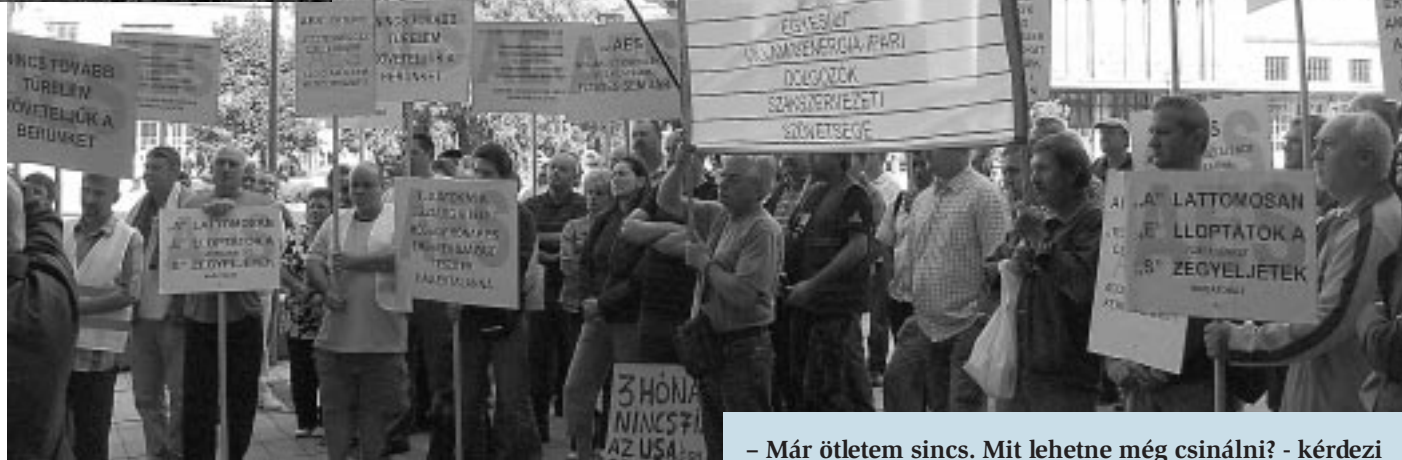
Demonstráció az AES ellen. Tiltakozik a LIGA, az EVDSZ, az EPSU és még sokan mások