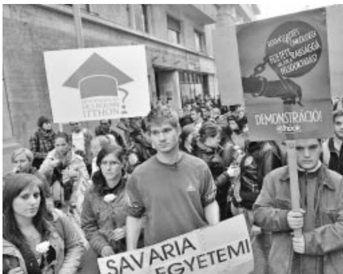
A hallgatók többször is tüntettek a felsőoktatási törvény tervezete ellen

A FELVÉTELI VIZSGÁHOZ egy C típusú, középfokú, államilag elismert nyelvizsga kötelező lesz 2016-tól. A szóbeli felvételi vizsga követelményeit 2012. december 31-ig kell meghatározni, első alkalommal a 2014/2015-ös tanévre történő jelentkezéskor szervezhető szóbeli felvételi. A törvényjavaslat rögzíti azt is, hogy egy felvételiző egy évben öt helynél többre nem jelentkezhet.