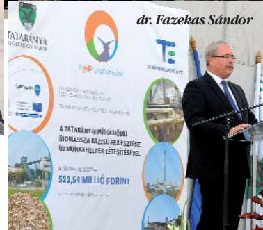
dr. Fazekas Sándor