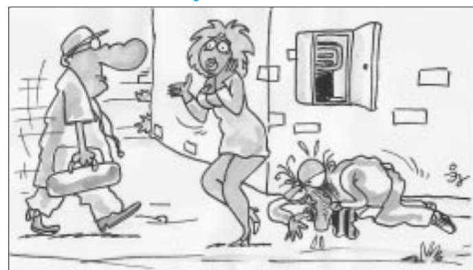
- Nem az áram ütötte meg, hanem a guta!