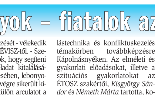
beutalás, stresszoldó tréningek. Továbbá egyéb