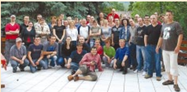
Riport a 7-8. oldalon

Az utóbbi években sokszor adtunk hírt arról, hogy az EVDSZ Ifjúsági Tagozata működése során milyen tevékenységet és munkát folytat az érdekvédelemben. A tagozat, mondhatjuk, egy kis szövetség a szövetségben, hiszen az iparág sokszínűsége, sajátos jellemzője azokkal a tagokkal és munkavállalókkal, akik még nem olyan régen egy oktatási intézményhez tartoztak.