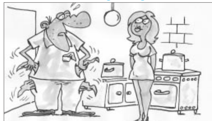
- Szívem, a hiánycél maradéktalanul teljesült...