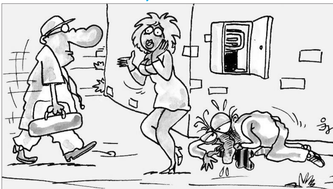
- Nem az áram ütötte meg, hanem a guta...