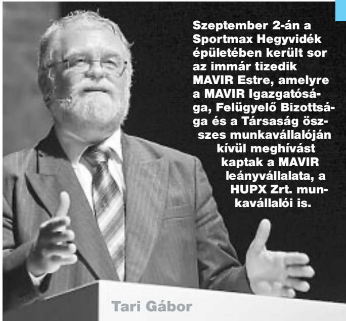
Szeptember 2-án a Sportmax Hegyvidék épületében került sor az immár tizedik MAVIR Estre, amelyre a MAVIR Igazgatósága, Felügyelő Bizottsága és a Társaság összes munkavállalóján kívül meghívást kaptak a MAVIR leányvállalata, a HUPX Zrt. munkavállalói is.