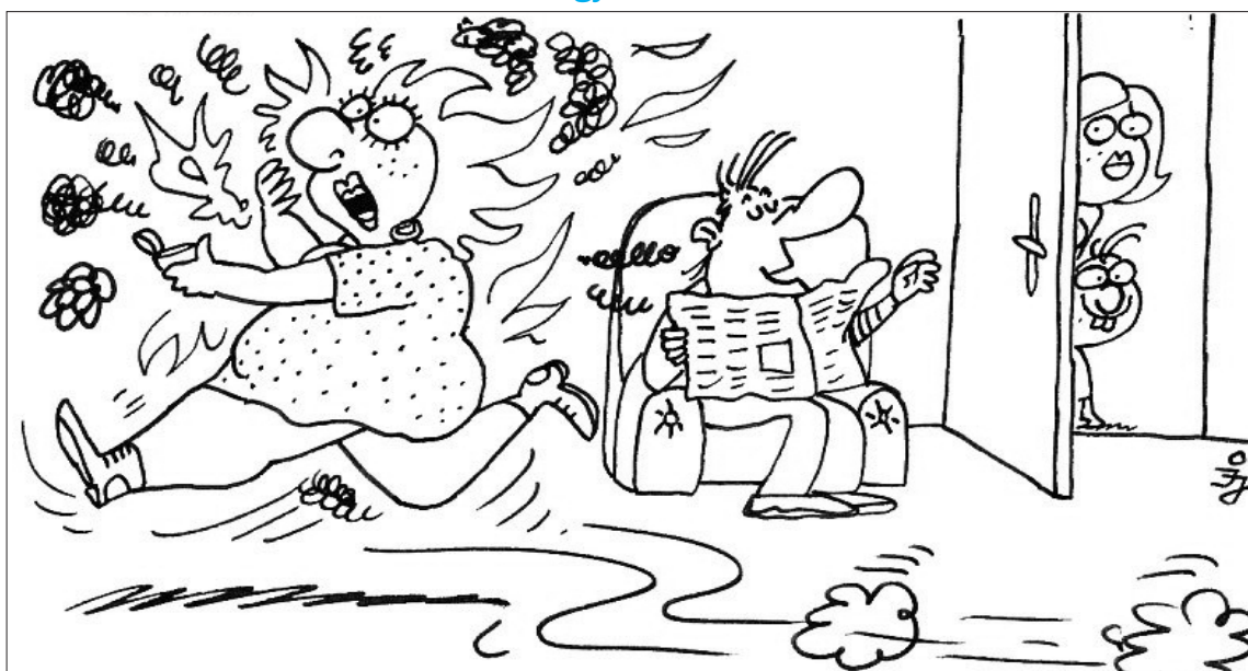
- A mama valami zsírregető kúrába fogott...