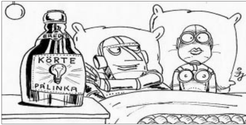
- Tudod, ebből meríték energiát...