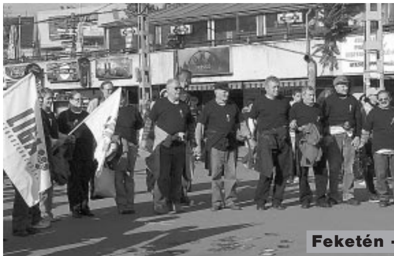
Feketén -- fehérén