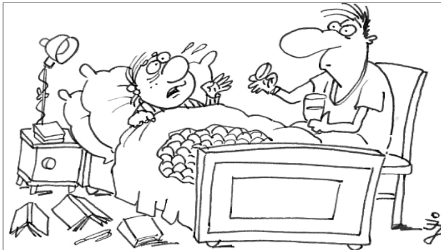
- Apu, túladagoltam a tanulást...