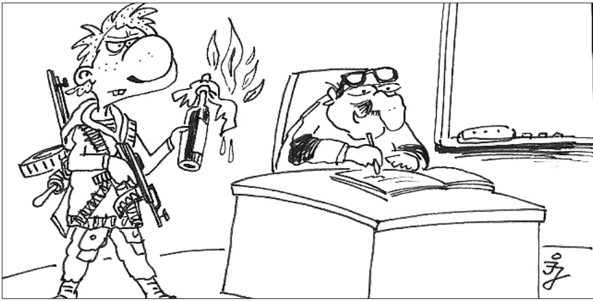
- Na, mondd meg őszintén, készültél, fiam?