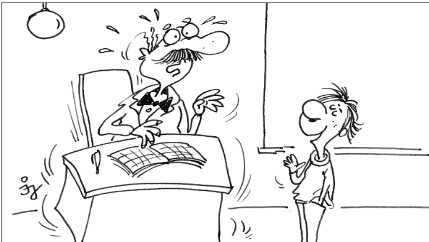
- Montecuccoli volt a peep-show feltalálója...