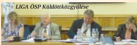
LIGA ÖSP Küldöttközgyűlése