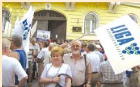
Demonstráció Miskolcon, júniusban.