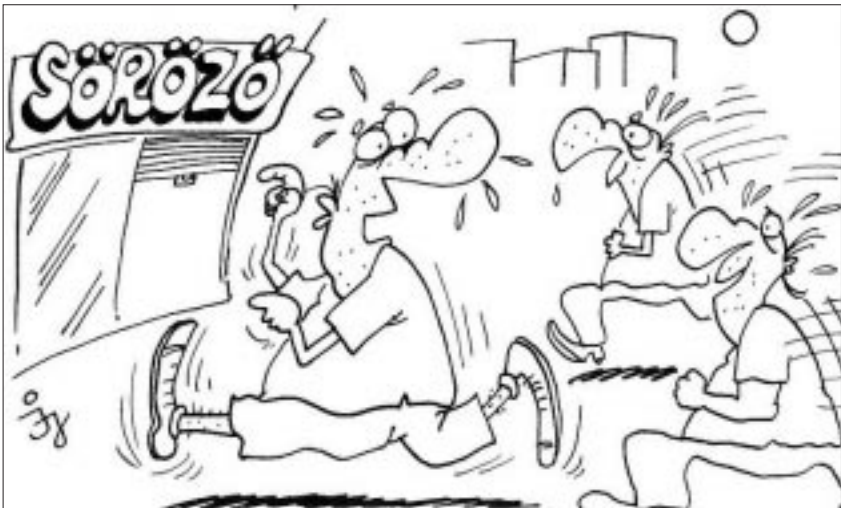
- Gyorsan fiúk, irány az óvóhely!