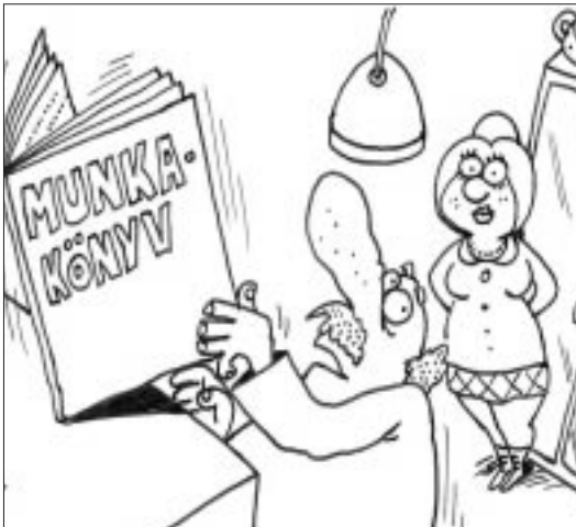
- Nekem nyitott könyv az életem...