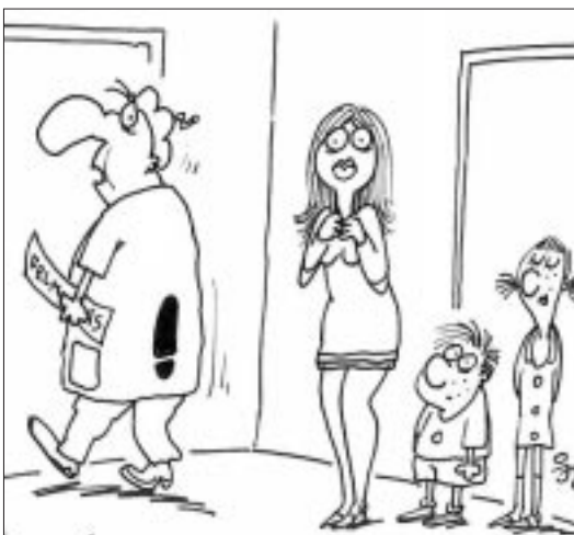
- Látnod, szívem, csak maradt valami nyoma az eltelt húsz évnem...