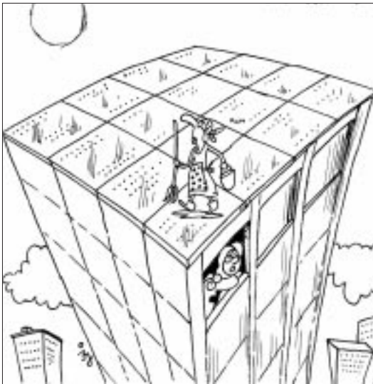
- A napelemekkel sokat megspórolunk, de a Bözsi néni már nem tudjuk fizetni