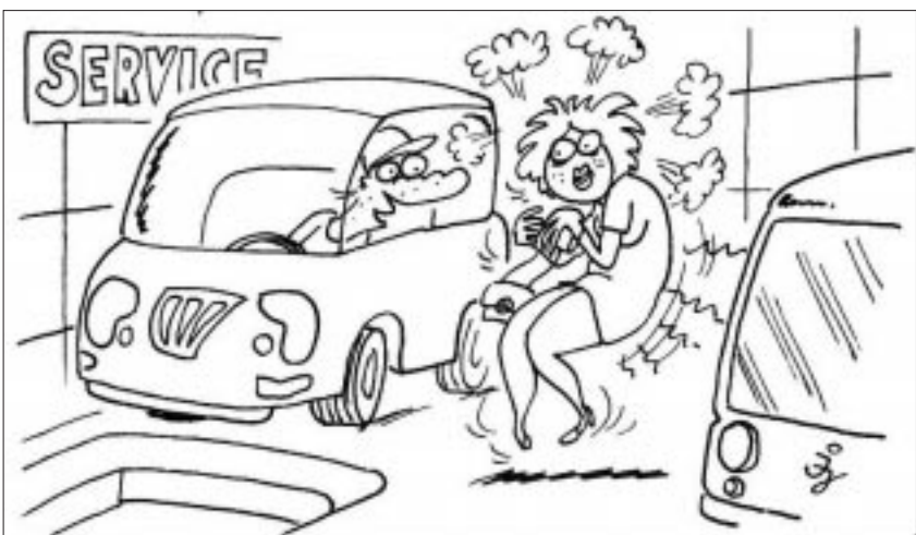
- Kisasszony, leégett a kuplungja... - Jujj, pedig a kocsiiban nem is dohányzom!