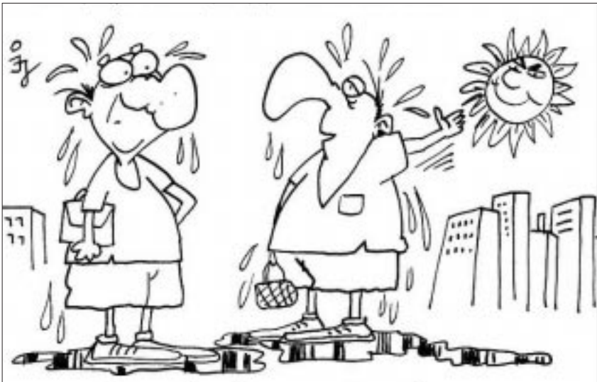
- Én már régóta napelemmel működöm