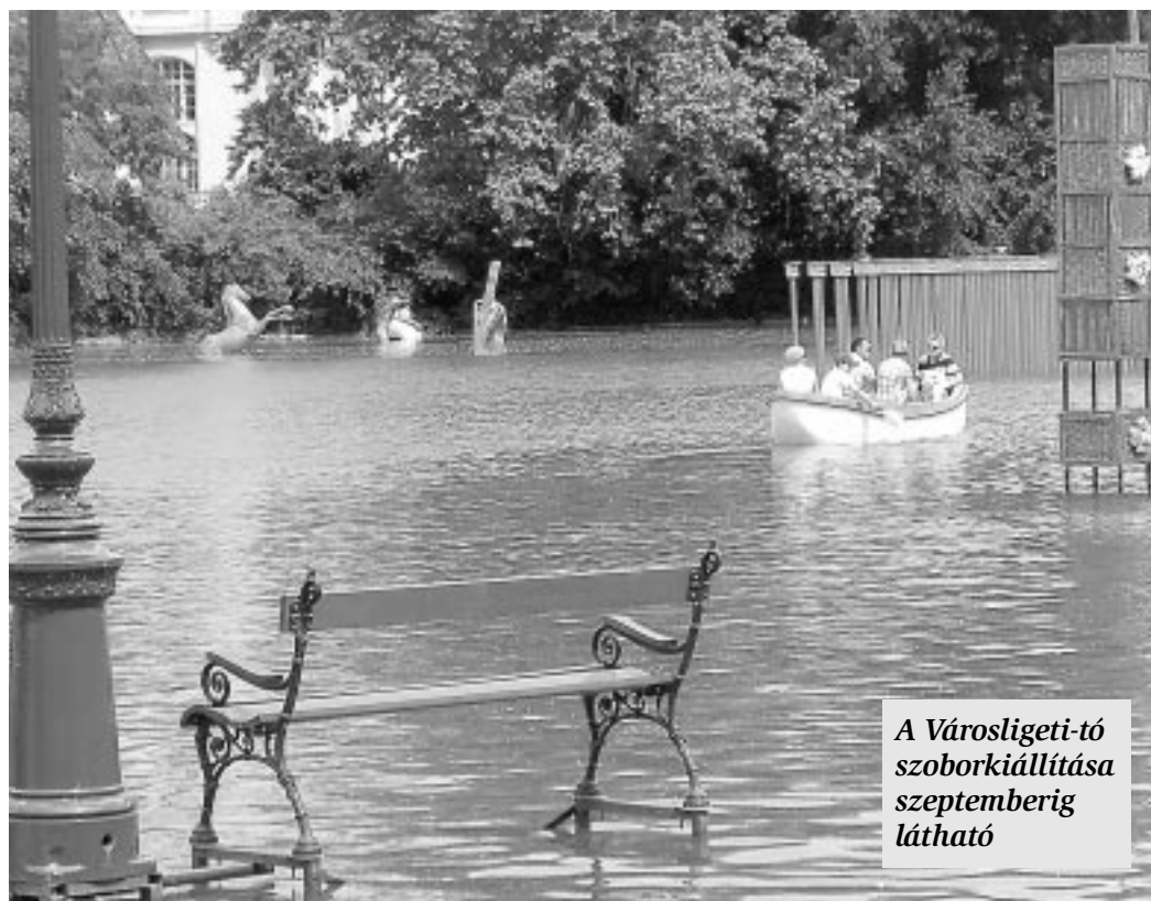
A Városligeti-tó szoborkiállításá szeptemberig látható