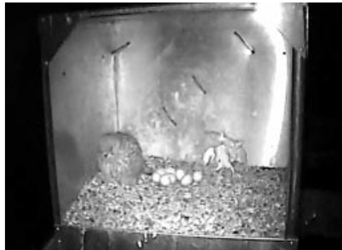
... és az udvarlás eredménye (éjjeli felvétel)