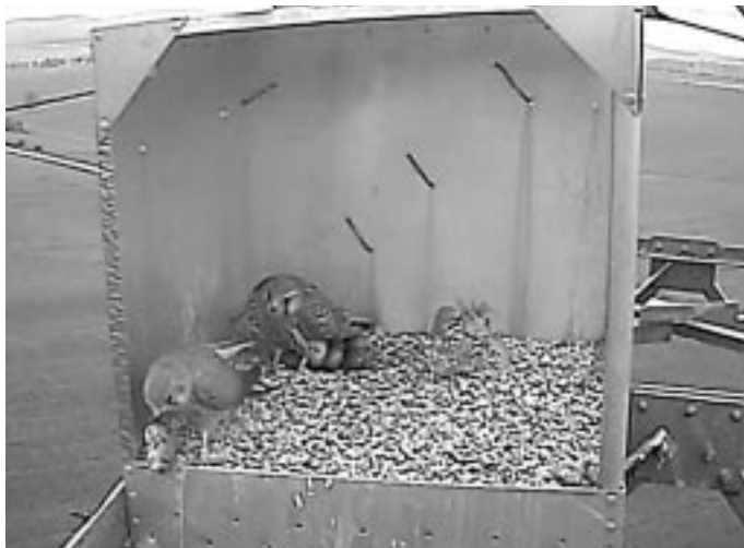
Udvarlás vércse módra pocokkal...