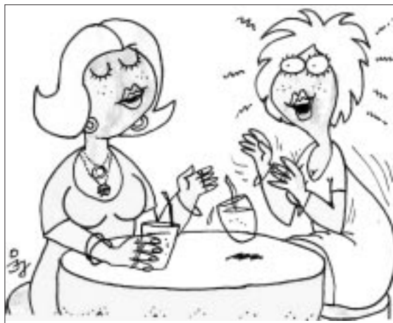
- Amit a férjem mond, az kőbe van vésve! - És hány karátosba?...