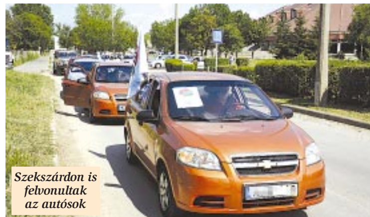
Szekszárdon is felvonultak az autósok