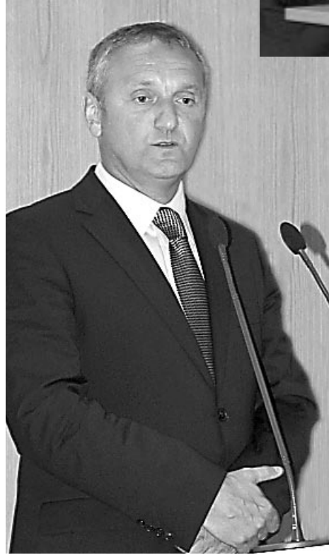
Baji Csaba Sándor , az MVM Zrt. elnök-vezérigazgatója

Baji Csaba Sándor, az MVM Zrt. elnök-vezérigazgatója elmondta, erős, sikeres, integrált, a regionális piacon is meghatározó nemzeti vállalatot építenek, amely támogatja a kormányzat energetikai céljainak megvalósítását, vagyis az ellátásbiztonságot és az energiafüggettség csökkentését, az energiatermelés és szolgáltatás fenntartható fejlesztését. A társaságcsoporthoz stratégiája ugyanakkor a tágabb nemzetgazdasági fejlesztéseket is segítheti, hiszen a magyar vállalatok versenyképességének növelése mellett beruházásai végrehajtásába beszállítóként bevonhatja a hazai kis- és középvállalatokat is. Ezzel az MVM Csoport növelheti a foglalkoztatást, s élénkítheti a magyar gazdaságot.