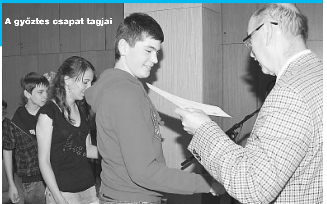
A győztes csapat tagjai