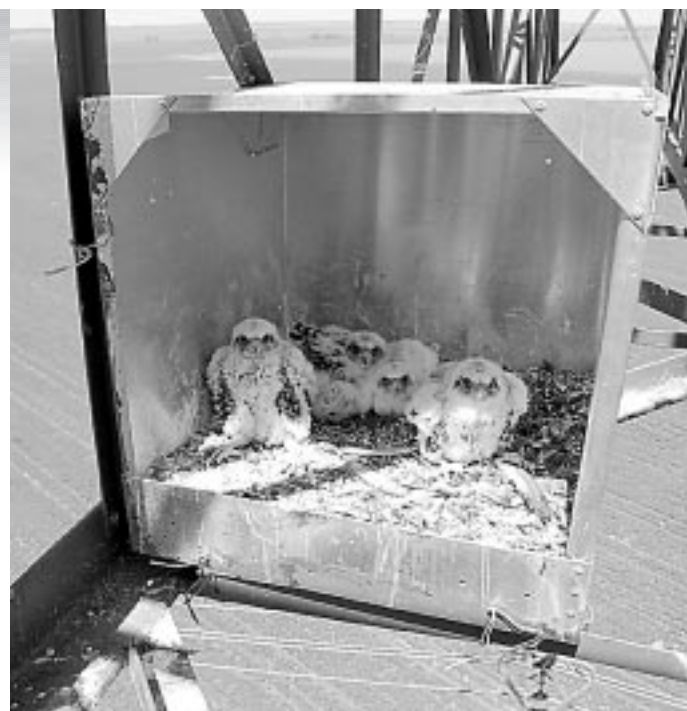
... és ilyen a műfészkek

Már érzem ahogy moccognak a tojásokban, úgy-