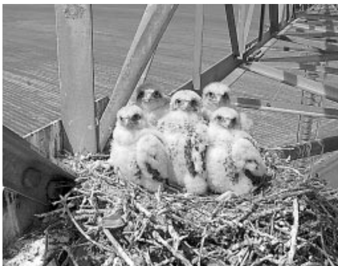
Ilyen az eredeti fészkek...

Ha így folytatjuk, igazi nagyfészkek leszünk. Már hat tojason ülök, illetve ülünk felváltva - hiszen enni is kell, főleg kotlaskor. Az itteni pocoknak egészen friss íze van és nem nehéz elkapni őket. Szerintem kicsit elhízta a nagy jó módban, jobb is lesz, ha a kevésbé életrelőlkötő elkapjuk. Jómagam csak a