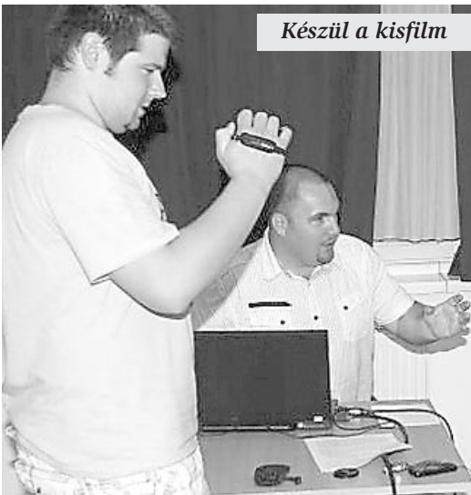
Készül a kisfilm

A szakszervezet helye és szerepe a társadalom csoportjai, intézményei közötti szociális párbeszédben fontos. Története hosszú időkre te-