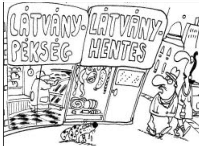
- Na ja, mindent a szemnek...