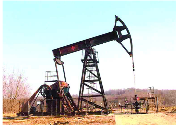
Himba a nagylengyeli kőolajmezőn

egyéb művelési eljárásokat vonnak be.” Közvetlenül a kőolajat nem használják fel – csak egészen ritkán –, a könnyebb felhasználás érdekében finomítóknál desztillációs eljárás keretében összetevőkre bontják. Motorhajtó üzemanyagok, tüzelőanyagok, illetve bitumen, kenőanyagok a végtermékek, ezek keletkeznek a frakcionáló toronyban, ahol a szétválasztás történik.