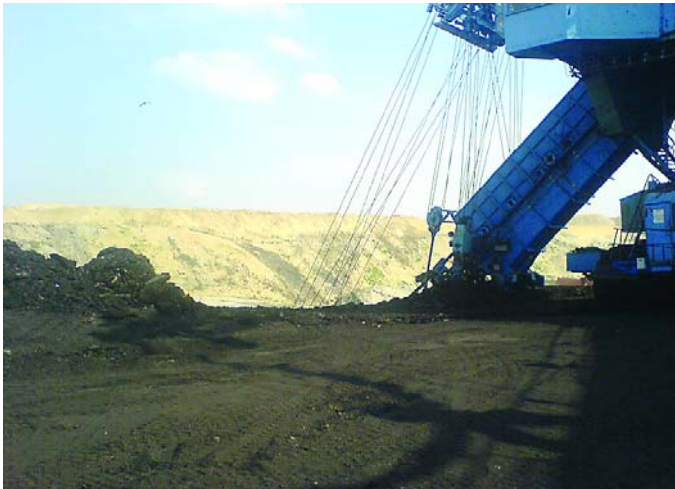
Bükkábrányi külszíni fejtés

A magyarországi szénkészlet közel 5 \cdot 10^9 t, amiből a kőszén 0,65 \cdot 10^9 t, a barnaszén 1 \cdot 10^9 t és a lignit mennyisége 3 \cdot 10^9 tonna. A kőszén Pécs és Komló környékén fordul elő, fűtőértéke 10-20000 kJ/kg magas kén- és hamutartalommal. A barnaszén a Dunántúlon és az északi bányavidéken fordul elő. Veszprém és Ajka környékén 12 000 kJ/kg a fűtőértéke 3 % kén- és 25-40 % hamutartalommal. Tatabánya, Oroszlány térségében 15 000 kJ/kg fűtőértékkel, 3 % kén- és maximálisan 40 % hamutartalommal. Lignit telep Visonta és Bükkábrány környékén található, fűtőértéke 6-7000 kJ/kg, kén-tartalma 1-1,5 %, míg hamutartalma eléri a 40 %-ot és nedvességtartalma igen magas.