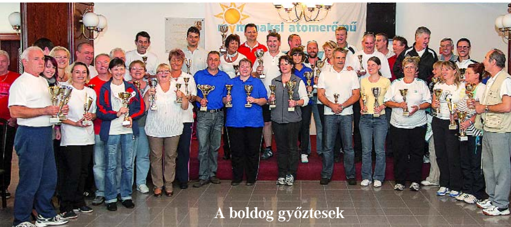
A boldog győztesek

Szombaton 8:00 - 20:00-ig csapatok és egyéni indulók versenyével folytatódott a találkozó. Azok, akik később lép-