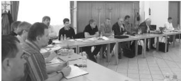
(Folytatás az 1. oldalról)

Elkészült a nyugdíjkorrekciós terv, amelyet megtárgyal az elnökség és bemutatják majd az új kormány-nak.