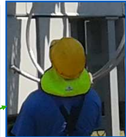
Párolgásos hűtésű nyakárnyékoló